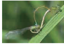
アオモンイトトンボ 交尾