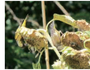
カワラヒワ ヒマワリの花が終わり 種が熟すとやって来ます