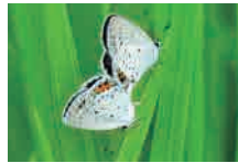
ツバメシジミ 交尾