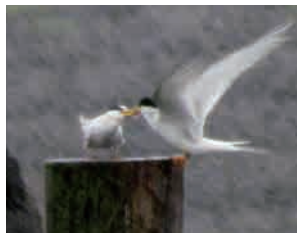
コアジサシ 杭で待っているメスに せっせと餌を運ぶオス