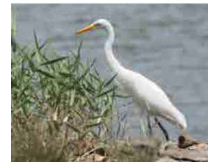
チュウサギ 夏鳥です。大きさ、額の カーブ、目元を見てね