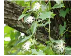
キカラスウリ 花の少ない夏に、白く 可憐な花が目立ちます