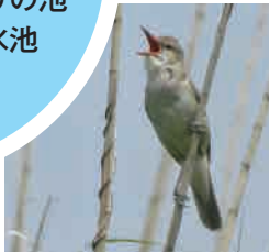
オオヨシキリ ご存じ騒々しい鳴き声は 初夏の風物詩