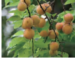
アズノの実 自然生態園に入るとすぐた わに実っています