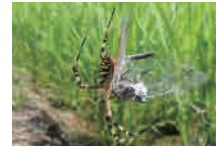
ナガコガネグモ vs. シオカラトンボ