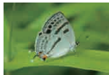
ミスズイロオナガシジミ