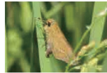
イチモンジセセリ 産卵