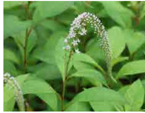
オオトラノオ 林縁に虎の尾に見立てた 白い花が咲きます