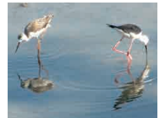
セイタカシギ親子 左が幼鳥、右側がお母さん。 かなり気がつよい