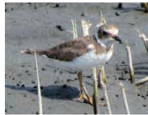
コチドリ幼鳥 前頭に黒色がなく、 坊主頭でかわいらしい