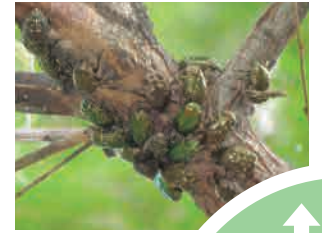
樹液のまわり 樹液にはカナブン、 ハナムグリの 仲間がびっしり