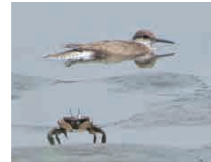
イソシギ 野鳥公園らしいでしょ。 猛暑の中ゆったり水風呂