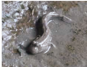
トビハゼ ネイチャーセンター 地下1階の干潟にいます