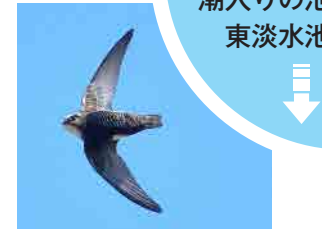
ヒメアマツバメ 1年通して、ブーメラ ン型で上空を滑空します