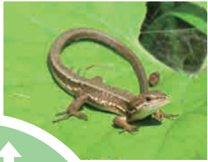
ニホンカナヘビ 足元で ゴソゴソガサガサ 時々日向ぼっこ