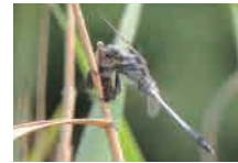
シオカラトンボ vs. イチモンジセセリ