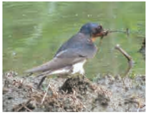
ツバメ 田んぼや干潟から 巣材を運びます