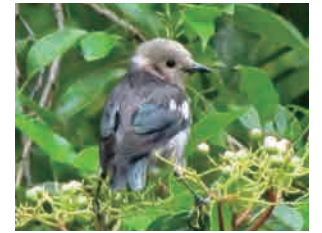
コムクドリ 淡いクリーム色の頭が かわいらしい夏鳥です