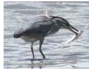
ササゴイと小魚 ゴイサギとは虹彩や羽根 の色合いが違います。