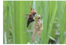
シオカラトンボ 羽化