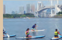
スタンドアップパドルサーフィン