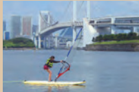
ウインドサーフィン

現在、試験的にレクリエーション水域を多様なマリンスポーツに開放しております。詳しくは右記「問合せ先」でお尋ねください。