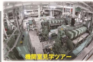
機関室見学ツアー