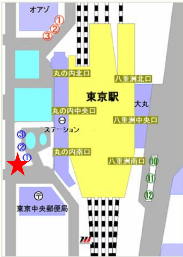
JR東京駅丸の内南口

JR東京駅丸の内南口、JR有楽町駅、都営大江戸線勝どき駅から都営バス(都05-1系統)「晴海埠頭」行きに乗車し、終点「晴海埠頭」下車。晴海客船ターミナル内送迎デッキについては、下記案内図を参照してください。