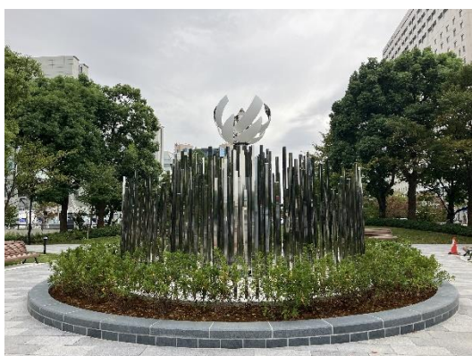
再設置された聖火台（石と光の広場横）

大会の貴重なレガシーとして、シンボルプロムナード公園石と光の広場横に再設置しました。近くにお立ち寄りの際は、ぜひご覧ください。