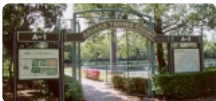
テニスコート入り口