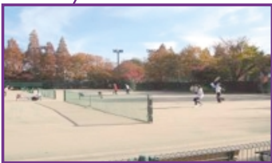
砂入り人工芝コート