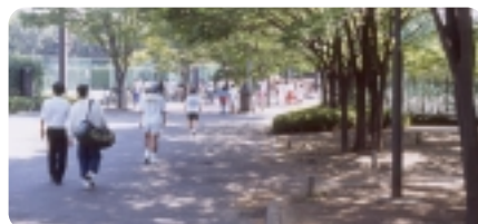
コートサイドの道