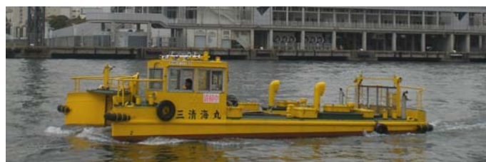
船名 第三清海丸 トン数6.15トン 昭和46年3月竣工 長さ10.7m 幅5.1m 深さ1.6m 馬力70ps×2基