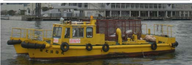
船名 第七清海丸 トン数10.9トン 昭和55年3月竣工 長さ10.9m 幅6.4m 深さ1.6m 馬力150ps×2基