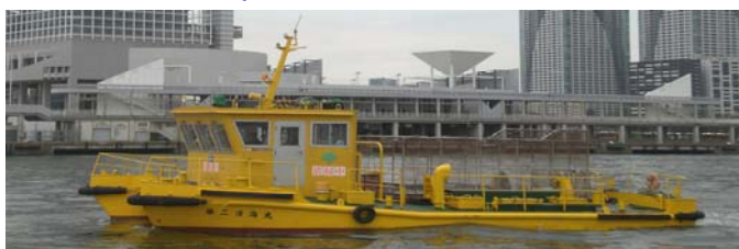
船名 第二清海丸 トン数14トン 平成12年3月竣工 長さ13m 幅6.6m 深さ1.7m 馬力230ps×2基