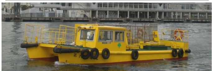
船名 第六清海丸 トン数16.26トン 昭和50年3月竣工 長さ10.9m 幅6.4m 深さ1.6m 馬力105ps×2基