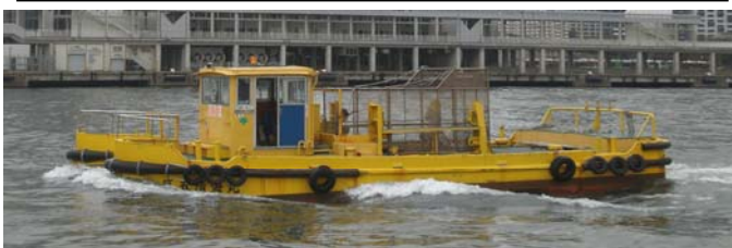
船名 第五清海丸 トン数15.64トン 昭和54年12月竣工 長さ11.2m 幅5.5m 深さ1.7m 馬力230ps×2基