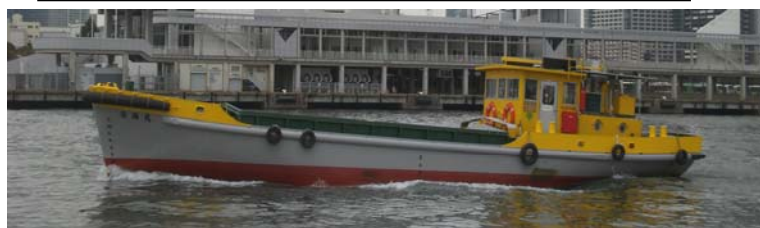
船名 清海丸 トン数 30トン 昭和60年3月竣工 長さ20.3m 幅5m 深さ2.1m 馬力105ps ◎ゴミ処理場に運搬する船◎